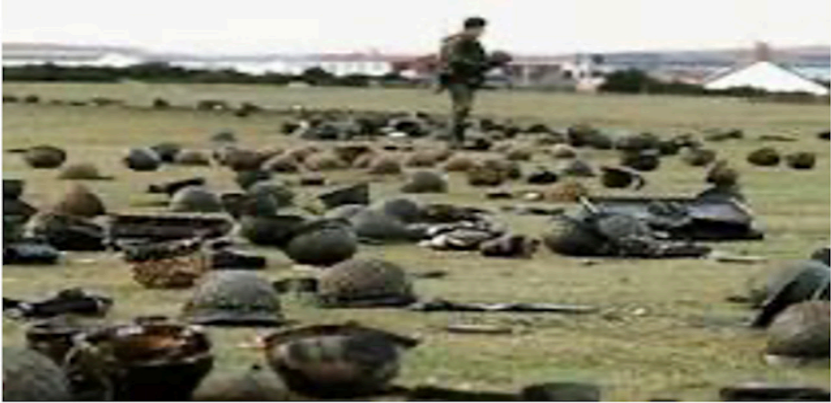
Figura 4. Rendición argentina