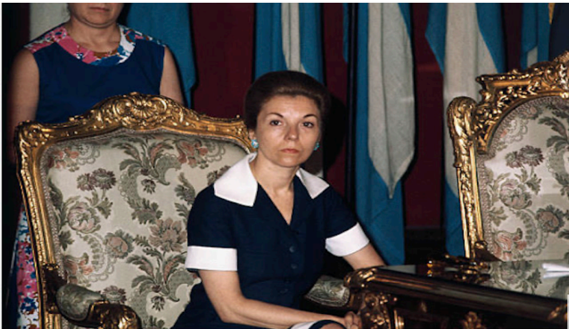
Figura 1. Isabelita, 2 a esposa de Juan Perón

Después de la muerte de Juan Domingo Perón, su segunda esposa, María Estela, apodada Isabelita, asumió el poder en julio de 1974, después de haber ocupado el cargo de vicepresidenta en el gobierno de su marido. Con la ayuda de su ministro de Bienestar Social, apodado el Brujo, organizó atentados contra la guerrilla peronista de los Montoneros con el fin de acabar con el deseo de instaurar el socialismo y, así, eliminar toda oposición a su política..