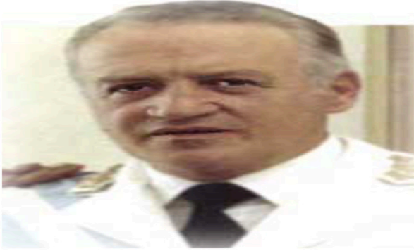
Figura 2. El nuevo presidente de Argentina (1981)