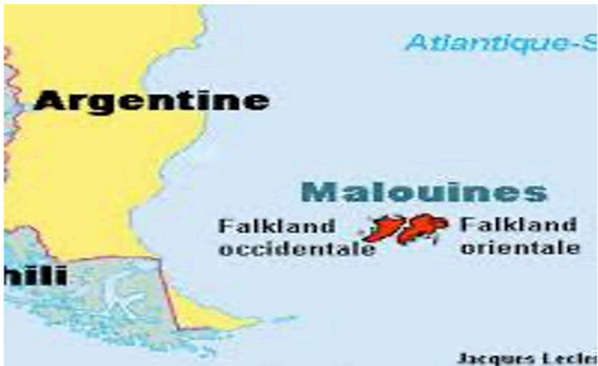
Figura 3. Ubicación de Falkland's Island

Las Islas Malvinas están alejadas de las costas argentinas por 600 km. Es uno de los catorce territorios británicos de ultramar. Viven en el sitio 3.000 personas con un gobierno propio, administrado por el Reino Unido.